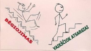
BĖGIOJIMAS VAIKŠČIUK ATSAUGIAI