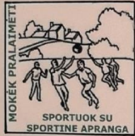
MOKĖK PRALAIMĖTI SPORTUOK SU SPORTINE APRANGA