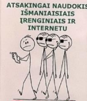
ATSAKINGAI NAUDOKIS IŠMANIAISIAIS ĮRENGINIAIS IR INTERNETU