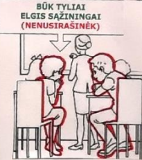
BŪK TYLIAI ELGIS SAŽINGAI (NENUSIRAŠINĖK)