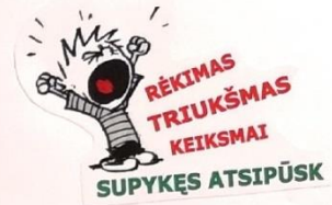
RĖKIMAS TRIUKŠMAS KEIKSMAI SUPYKĖS ATSIPIŠK