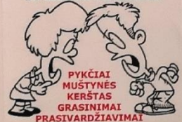
PYKČIAI MUŠTYNĖS KERŠTAS GRASINIMAI PRASIVARDŽIAVIMAI

ATSITRAUK, PADARYK PERTRAUKĄ IR IEŠKOK PAGALBOS