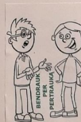
BENDRŲ RŪKŲ PERTRAUKA