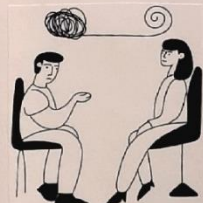
JEI SUNKŲ – KALBĖKIS SU SUAUGUSTAIS