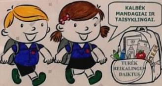
KALBĖK MANDAGIAI IR TAISYKLINGAI. TĖRĖK REIKALINGUS DAIKTUS DĖVĖK UNIFORMA