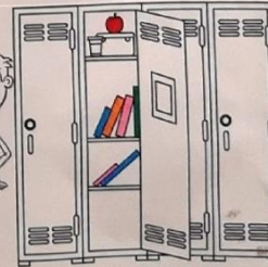
SAUGOK SAVO DAIKTUS