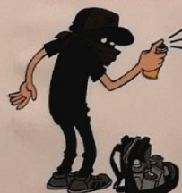
RŪPINKIS MOKYKLOS ŠVARA IR ESTETIKA