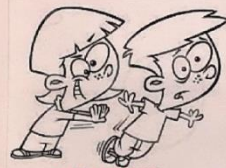
STUMDYMASIS NEATSARGUS ELGESYS SAUGOK VISŲ SVEIKATĄ