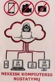
NEKEISK KOMPIJUTERIO NUSTATYMŲ