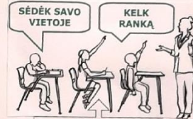
SĖDĖK SAVO VIETOJE KELK RANKA BŪK TYLIAI ELGIS SAŽINGAI (NENUSIRAŠINĖK)