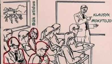
BŪK ATIDUS KLAUSYK MOKYTOJO IŠJUNK TELEFONĄ IR VALGYK KUPRINĖJE VALGYK VALGYKLOJE MOKYKIS IŠ VISŲ JĖGŲ!