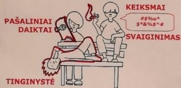
KEIKSMAI PAŠALINIAI DAIKTAI SVAIGINIMAS TINGINYSTĖ